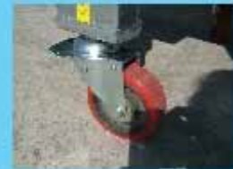
大型キャスターで楽々移動