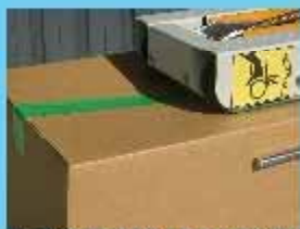
底を貼り付け空箱完成