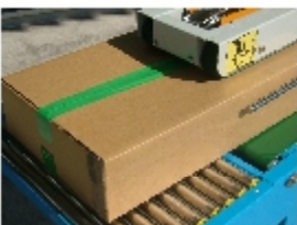
両面貼り付け梱包完成