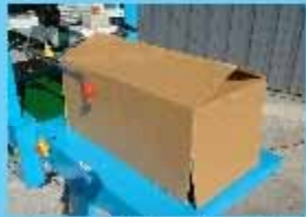
フラップ立てたまま底貼り!