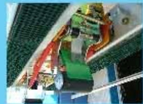
操作性・安全面も考慮しました。