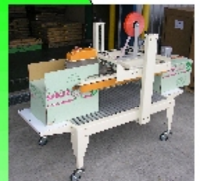
空箱の底を貼り付け