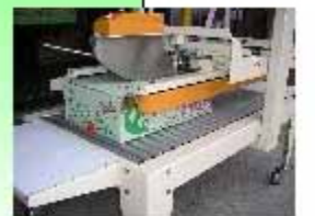
製品入れ上面梱包